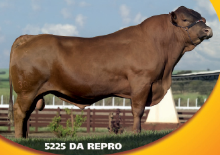
5225 DA REPRO