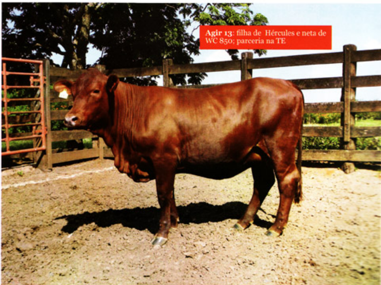
Agir 13: filha de Hércules e neta de WC 850: parceria na TE