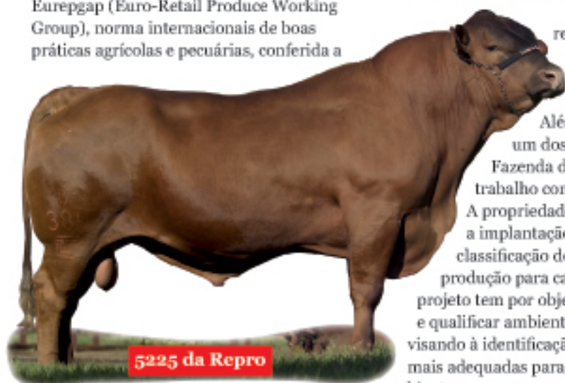
5225 da Repro

produtores que atuam dentro de práticas adequadas ao manejo, com respeito ao meio ambiente, saúde animal, integridade humana, uso racional de defensivos e mecanismos para rastreabilidade.