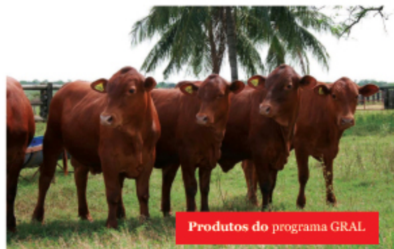
Produtos do programa GRAL