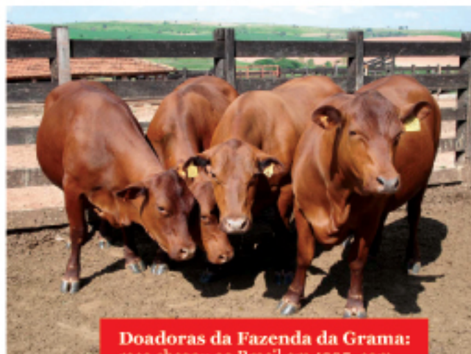
Doadoras da Fazenda da Grama: raça chegou ao Brasil em 1995, com a importação de doses de sêmen