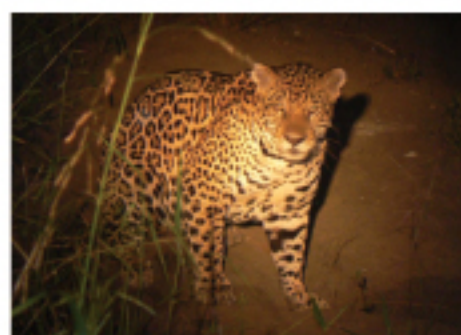
Dois belas imagens da Fazenda San Francisco: o Senepol à beira do Rio Miranda (no alto) e uma onça-pintada flagrada à noite