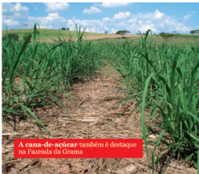
A cana-de-açúcar também é destaque na Fazenda da Grama

técnico da Coan Consultoria e doutor em Produção Animal. "Este é o compromisso da Fazenda da Grama com o bem estar de seus animais, garantindo aos pecuaristas de todo o Brasil, as melhores condições para se obter uma genética de qualidade, para que eles conquistem os melhores